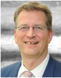
Dr. Ralf Brauksiepe