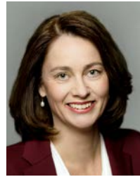
Dr. Katarina Barley